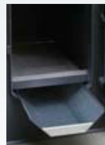
Cámara de combustión