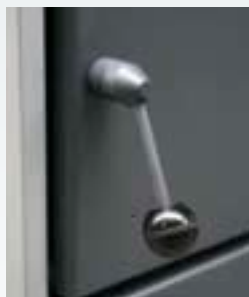
Detalles de cierre y bisagra