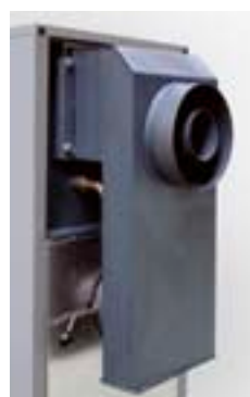
2 cámaras de combustión con 1 única salida de chimenea